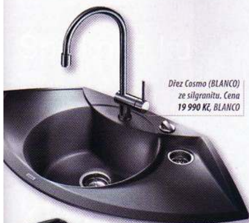
Dřez Cosmo (BLANCO) ze silgranitu. Cena 19 990 Kč, BLANCO