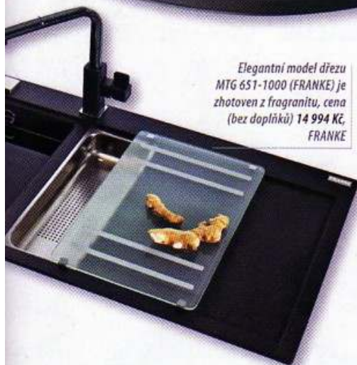
Elegantní model dřezu MTG 651-1000 (FRANKE) je zhotoven z fragranitu, cena (bez doplňků) 14 994 Kč, FRANKE

Jakkoli je již vysoké procento českých domácností vybaveno myčkami nádobí, bez dřezu se v kuchyni nikdo neobejde. U některých typů nádobí, jako je například starší ozdobné sklo, keramika, nádoby s nepřílnavým povrchem aj., se mytí v myčce nedoporučuje. Nejedna hospodyně navíc dává u méně zašpiněného nádobí (hrnky od čaje, sklenice od minerálky a podobně) přednost ručnímu mytí. Dřez se však v kuchyni hojně využívá i k oplachování ovoce, zeleniny a dalších potravin.