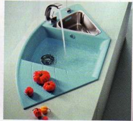
Model Lotus (SCHOCK) v barvě nuvoletta s velkorysým vnitřním prostorem. Cena 18 921 Kč, SUITE