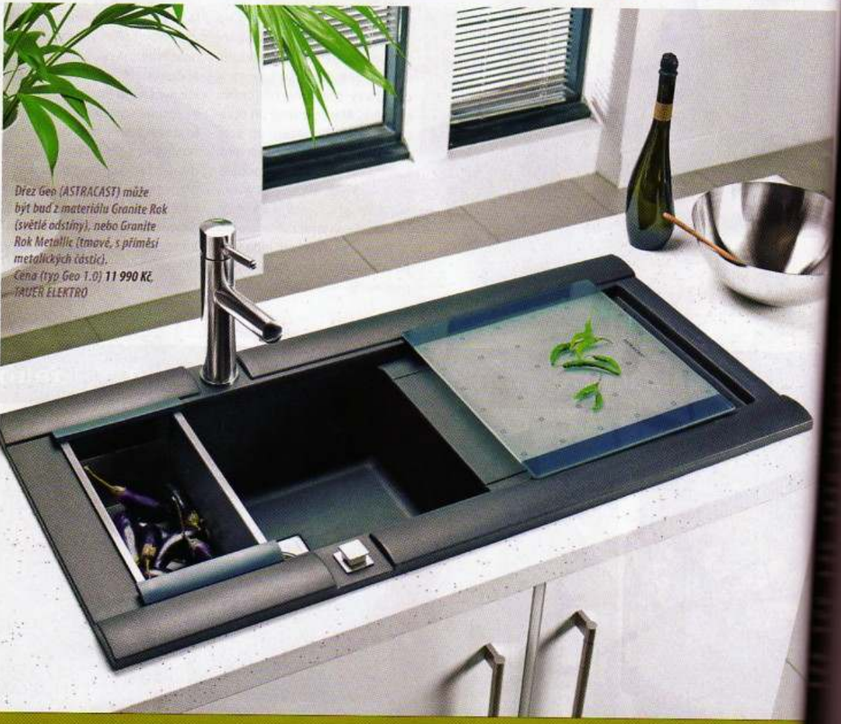
Dřez Geo (ASTRACAST) může být buď z materiálu Granite Rok (světlé odstíny), nebo Granite Rok Metallic (tmavé, s příměsí metalických částic). Cena (typ Geo 1.0) 11 990 Kč TAUER ELEKTRO