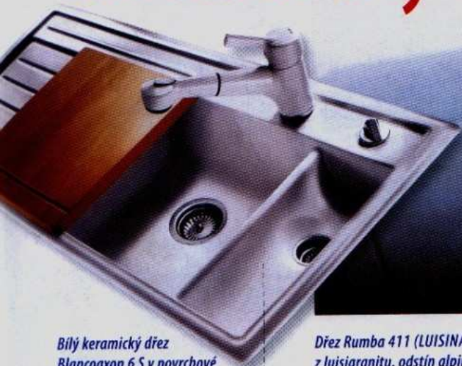
Bílý keramický dřez Blancoaxon 6 S v povrchové úpravě PuraPlus s krájecím bukovým prkénkem. Cena (bez DPH) 23 300 Kč, BLANCO