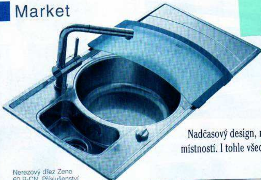
Nerezový dřez Zeno 60 B-CN. Příslušenství zahrnuje skleněnou pracovní desku a cedňikovou nerezovou misku. Šířka dřezu 60 cm. Cena: Kč 10 990 Kč, TEKA

Nový typ fragranitového dřezu KBG v grafitové barvě, vhodný pro spodní zabudování (do žuly, corianu či kerrocku), se skrytým přepadem. Doporučená cena 12 971 Kč, FRANKE