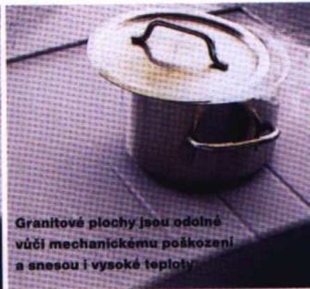
Granitové plochy jsou odolné vůči mechanickému poškození a snesou i vysoké teploty