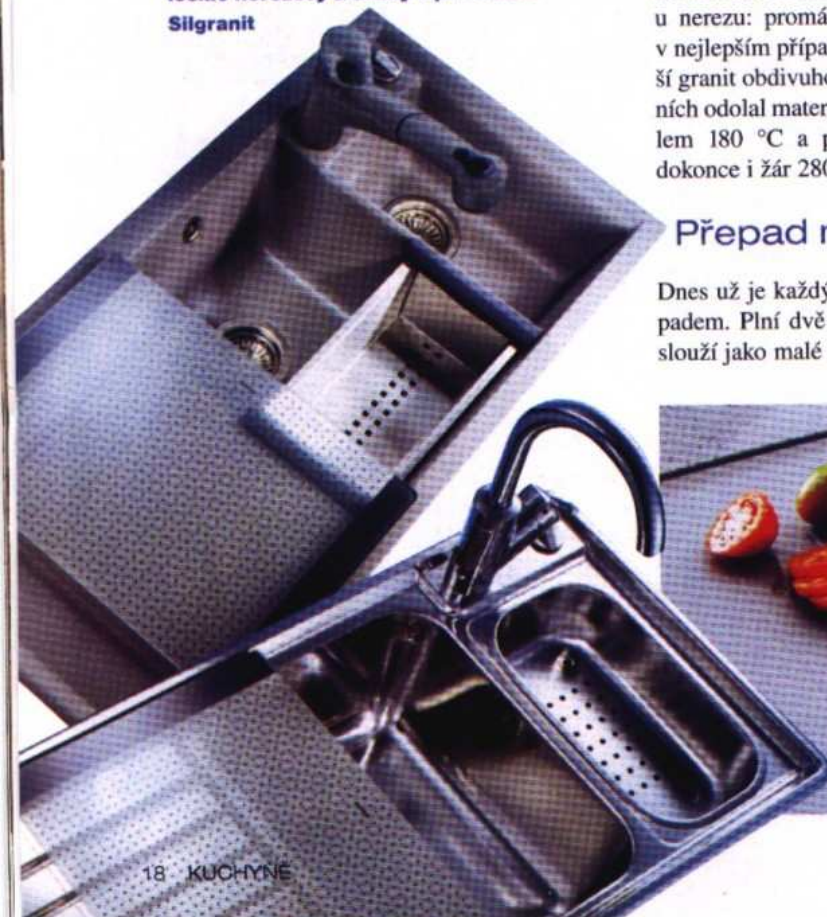
↓ BLANCOAXIS (Blanco) a BLANCOAIA 6 S (Blanco) Sourozenci z jedné řady, jeden leskle nerezový a druhý v provedení Silgranit

ale až 1 mm, někdy i více. Slabší nekupujte. Představte si, jak se bude chovat plech, který viditelně pruží už při mírném tlaku rukou, když ho naplníte vodou a manipulujete se stojánkovou baterií do něj upnutou. Aby vynikla krása nerez, musí být bezpodmínečně naleštěný. To ale neplatí u moderních profilovaných plechů. Jejich strukturovaný vzhled je efektní, vůči poškrábání podstatně odolnější a kapičky zaschlé vody na něm nejsou tolik zřetelné. Zato čištění je obtížnější, v četných záhybech se časem usadí vodní kámen.