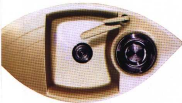
↑ FOKUS C-150 (Schock) – rafinovaný a zvláštní dřez pro náročné