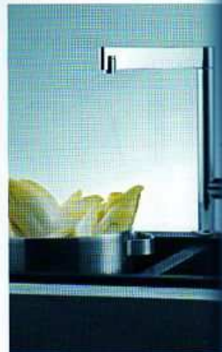
Chromová baterie Franke FG 600 především svým designem rovněž perfektně ladi s fragrantovanou dřezem. Cena: 8925 Kč. FRANKE

Kompozitní (granitový) dřez je vyroben ze směsi křemičitých písků se žulou (80 %), akrylátu (15%) a barviv (5 %). Na výběr máte mnoho různých odstínů barev, materiál vyniká hygieničností a snadnou údržbou, nemusíte ho leštit, nevybledne, nepoškrábe se, neobarví se od vína či kávy, neublíží mu ani agresivní čisticí prostředky, zvládne i vysoké teploty (maximum 280 °C) a silný náraz klidně i z metrové výšky. Výrobce díky těmto vlastnostem poskytuje většinou prodlouženou záruku na pět až deset let. Při koupi ale buďte obezřetní, „granitový“ jednodřez pod 5000 Kč nekupujte, nebude nejspíš tím, za co se vydává. Vždy po prodeji požadujte specifikaci obsahu kameniva v materiálu, použitého pojiva a zejména informaci, zda je materiál v celé tloušťce (minimum je 6 mm) homogenní. Homogenita materiálu vám totiž zaručí, že dřez prakticky ne-