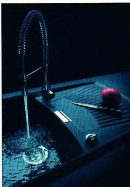
Granitový dřez Schock Venus z materiálu Cristalite můžete mít v dalších 15 barvách, cena: 11 000 Kč, baterie Schock Ideos Pro stojí také 11 000 Kč. SUITE

Kuchyňský dřez Blanco Lexa 9E je z bílého Silgranitu, vyrábí se v deseti barvách a rozměrech 1070 x 510 mm, hloubka 190 mm, může být použit i jako rohový. Cena: 15 120 Kč, s excentrickým ovládním výpusti stojí 15 840 Kč. BLANCO